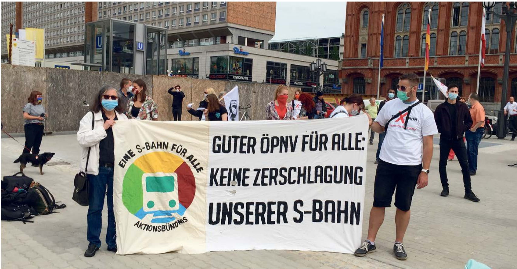
Demo gegen S-Bahn-Zerschlagung und -Privatisierung, Alexanderplatz, 22. Mai 2020

Was Wettbewerb genannt wird, ist eine Privatisierung. In Antworten auf Bürger*innenanfragen bemühen sich Senatsmitarbeiter*innen zu beschwichtigen. Statt von Privatisierung spricht man von »Rückgriff auf die erforderliche Expertise privatwirtschaftlich verfasster Bahnunternehmen« unter »Zugrundelegung anspruchsvoller Sozialstandards«. Man hofft auf »gute Angebote zu angemessenen Preisen«. In Wirklichkeit spielt der Senat S-Bahn-Roulette auf Kosten von Beschäftigten und Nutzer*innen. | Carl Waßmuth