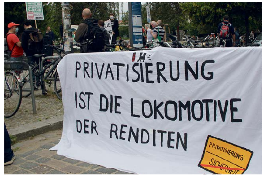
Demo am Ostkreuz gegen S-Bahn-Privatisierung, 19. Juni 2020

2009 Im Januar 2009 frieren die Fahrsperrungen ein. Etliche weitere Störungen folgen in diesem Jahr. Mehrere S-Bahnlinien werden eingestellt, später wird nur mit ausgedünntem Fahrplan und verkürzten Zügen gefahren.