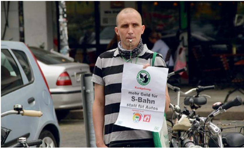
Demo am Ostkreuz gegen S-Bahn-Privatisierung, 19. Juni 2020

Bahner*innen und Bürger*innen vereint: Aktionsbündnis EINE S-Bahn für ALLE